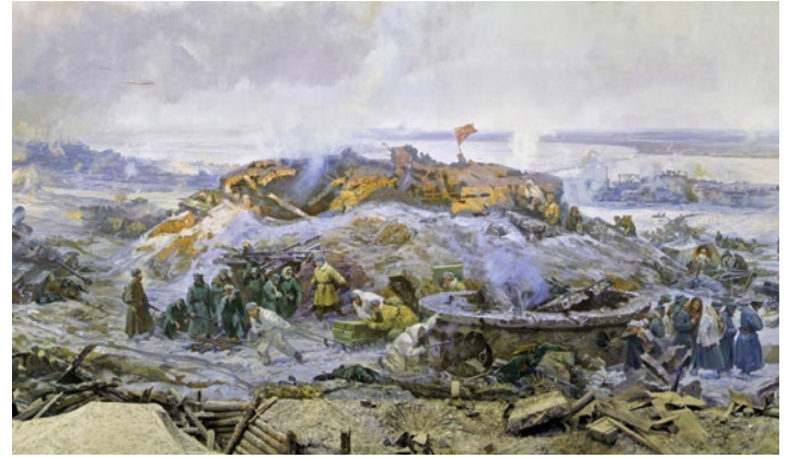
Официальное донесение парткома СталГРЭС от 31 декабря 1942 года:

«Уже с первых дней августа Сталинград начал подвергаться систематическим налетам вражеской авиации. Поэтому и коллективу «Сталэнерго» приходилось работать в условиях частых «воздушных тревог» и заступать на очередную вахту почти без отдыха. В результате массовых налетов и бомбежки города 23–25 августа были основательно повреждены линия передач от ГРЭС до города и городская электрическая подстанция, вследствие чего снабжение электроэнергией города прекратилось. Восстановление проходило в весьма тяжелой обстановке, под непрерывной бомбежкой вражеской авиации. Но, несмотря ни на какие трудности, линия электропередачи и городская подстанция были восстановлены, и к 29 августа город получил электроэнергию, что дало возможность пустить водопровод, городскую мельницу и обеспечить население водой и хлебом».