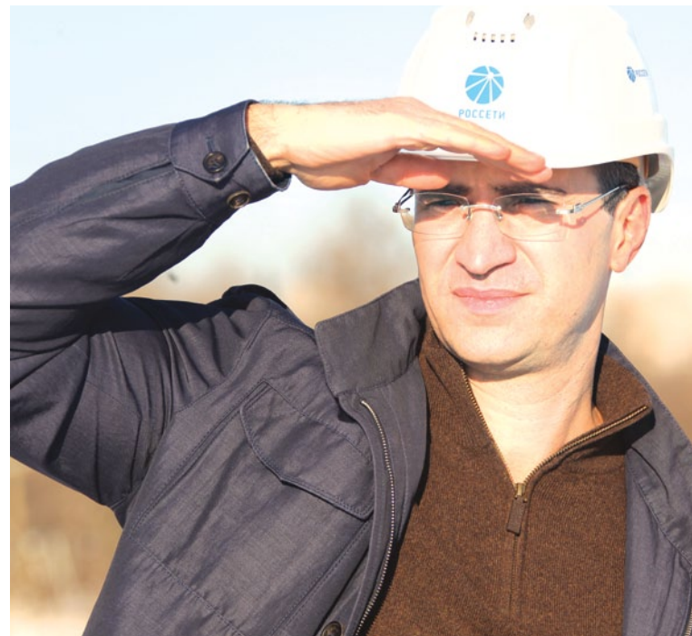
Борис Борисович, 2017 год особый в истории нашей компании - МРСК Юга отметил свой десятилетний юбилей. Каковы основные итоги ушедшего года? Как Вы в целом оцениваете результаты, достигнутые компанией за последние 10 лет?

В 2017 году дружный и профессиональный коллектив нашей компании обеспечил достижение весомых положительных результатов. По предварительным данным, МРСК Юга закончила год с чистой прибылью более 450 млн. рублей. Увеличилась и выручка от реализации продукции – по прогнозам она составит свыше 35 млрд рублей. Прошлый год стал первым за долгое время, когда уровень дебиторской задолженности снизился. Значительно повысилась эффективность реализации инвестиционной программы, существенно возросла производственная деятельность компании. Таким образом, мы можем констатировать улучшение финансово-экономического положения нашей компании. Все это стало возможным благодаря многолетней кропотливой работе. Компания менялась, совершенствовалась, осваивала новые направления деятельности. По всем проблемным вопросам, наряду с техническими мероприятиями, проводились и кадровые, и организационные, не все получалось сразу, требовались корректировки, где-то кардинальные. Энергетическая отрасль напрямую зависит от динамики социально-экономического развития. Именно рост экономики создал условия для принципиальных изменений в отечественном ТЭК, в том числе и в распределительном сетевом комплексе Юга России. Благоприятная экономическая конъюнктура обеспечивает возможность эффективно работать и успешно решать ключевые задачи, стоящие перед нами.